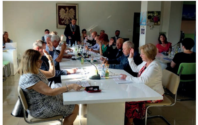
Zdjęcia UG Klucze

Obie inwestycje są realizowane ogromnym nakładem finansowym z kosztem całkowitym ponad 25 000 000 zł, na który składają się wkład własny oraz skutecznie pozyskiwane wsparcie zewnętrzne.