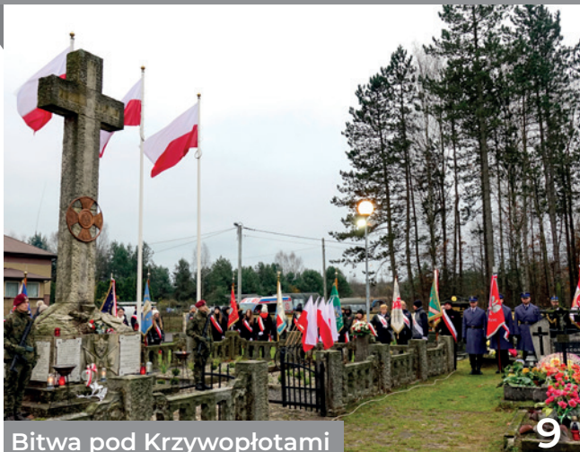
Bitwa pod Krzywopłotami