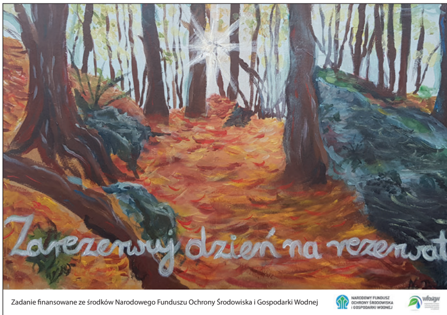
Zadanie finansowane ze środków Narodowego Funduszu Ochrony Środowiska i Gospodarki Wodnej