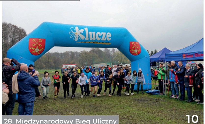
28. Międzynarodowy Bieg Uliczny